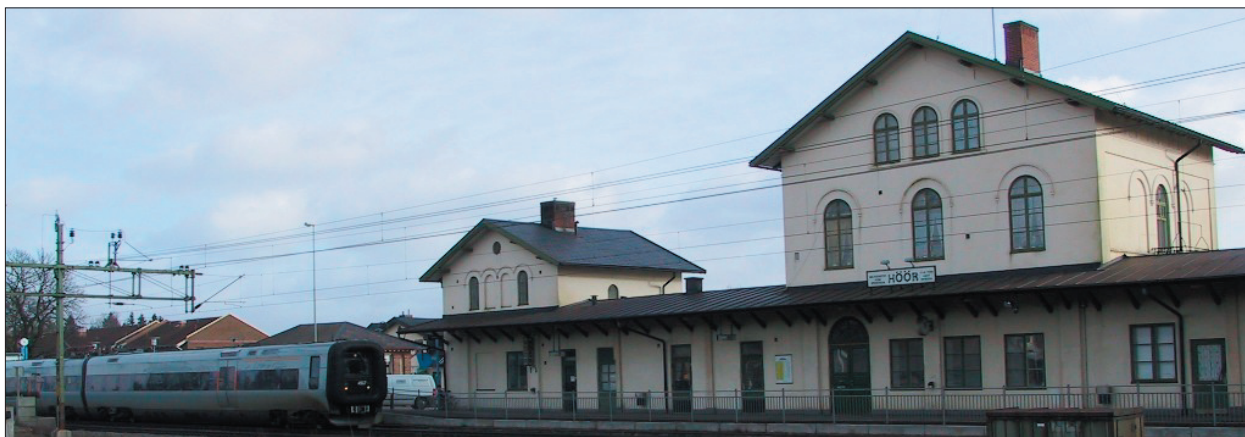
Öresundstågen ger Höör direkt förbindelse med Köpenhamn, Humlebeck med konsthallen Louisiana och Helsingör

Vägverket har utarbetat en vägutredning för E22, avsnittet Hurva-Fogdarp. Kommunen har i yttrande förordat en sträckning söder om Rolsberga. Vägverket har därefter beslutat att förslaget med befintlig vägsträcka genom Rolsberga, ska vara det alternativ som utreds i det fortsatta arbetet i planerings- och projekteringsprocessen.