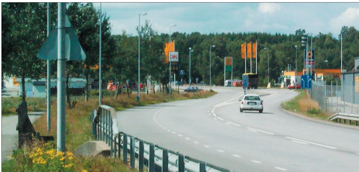
Hastighetsbegränsning till 50 km/tim har genomförts på väg 23 genom Höörs tätort

Kommunens viktigaste projekt, ny sträckning av väg 23, finns inte medtagen i den nu gällande planen. Arbetet med en plan för perioden 2002–2011 har påbörjats. Kommunen framhåller vikten av att få med väg 23 i den nya planen med påbörjande snarast möjligt. Även frågan om tågstopp i Tjörnarp förs fram i diskussionerna.