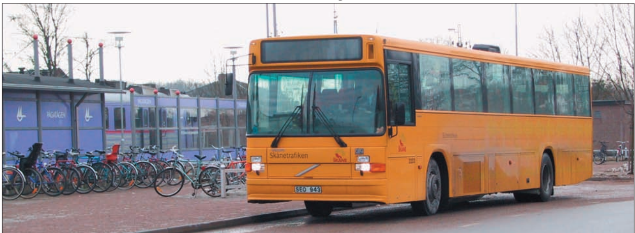
Stationen i Höör är navet i busslinjesystemet

Kommunen har som målsättning att bygga ut cykelvägnätet. Höörs centrum och stationsområdet ska vara navet i detta nät. Nya cykelvägar är anslagna mellan HöörVäster och centrum, längs Stenskogsvägen, Sätöfta till Nyby och Orups idrottsplats. Vidare är ett stråk mot Frostavallen och Skånes Djurpark samt mellan Höör och Hörby viktiga. Det finns också ett behov av att bygga en gång- och cykelväg längs hela väg 23 inom kommunens gräns.