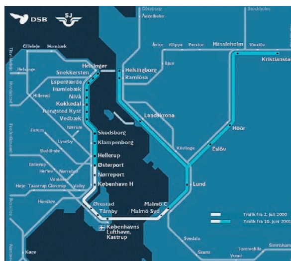
Öresundstågens sträckning och hållplatser