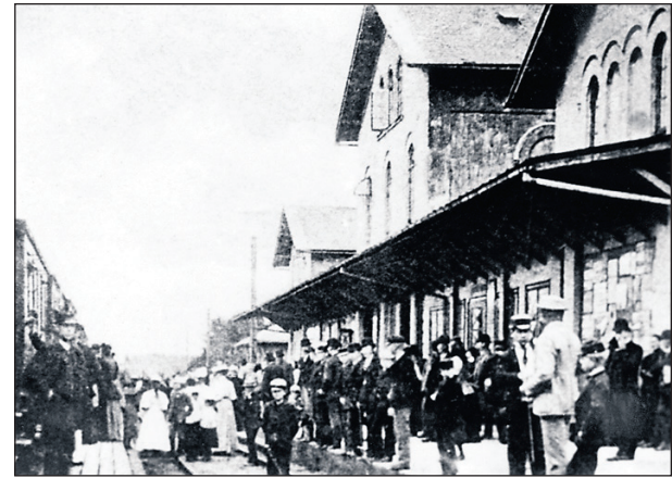
Höör järnvägsstation på 1890-talet.