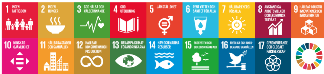
Figur 2 Genomförandet av avfallsplanen bidrar till att uppfylla flera av de globala hållbarhetsmålen.