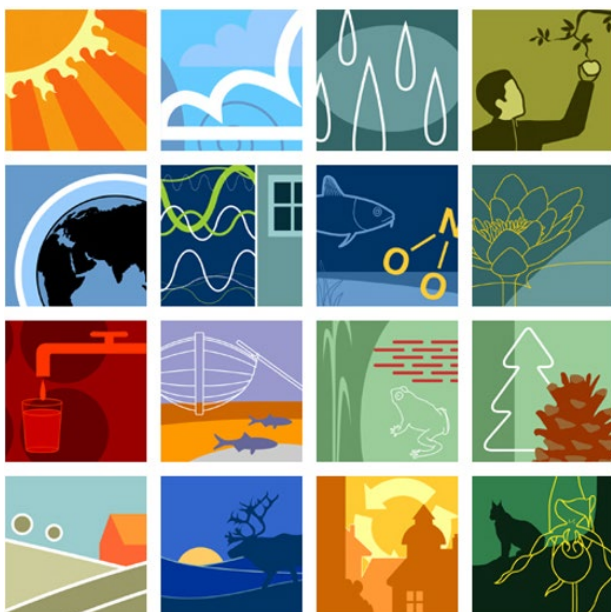
Figur 1 De 16 nationella miljömålen är en viktig grund för avfallsplanens mål och handlingsplanens åtgärder. Genomförandet av avfallsplanen och dess handlingsplan bidrar till att uppfylla flera av de nationella miljömålen.

I samverkan med bland andra de skånska kommunerna har länsstyrelsen i Skåne tagit fram ett regionalt handlingsprogram, Tillsammans för ett hållbart Skåne , med åtgärder som ska bidra till att miljömålen uppfylls. De regionala åtgärder som hanterar frågor inom ramen för avfallsplanens avgränsning har lyfts in i avfallsplanen i de fall det har bedömts lämpligt. Det gäller dock inte åtgärder som innebär tillsyn enligt miljöbalken.