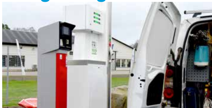
Gasmacken ligger bakom Hardys gatukök, vid rondellen där väg 13 och 23 korsar varandra.

I början av december öppnar en gasmack i Höör. Ett tankställe för biogas har länge funnits på kommunens, men också många privatpersoners önskelista.