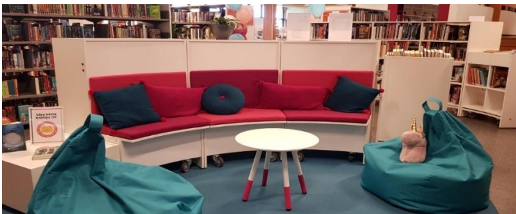
Bild från Höors Biblioteks nya 9–13 avdelning. Övriga bilder i Kulturplanen är hämtade från Älvkullen, Höors Musikskola och Höors biblioteks nya 9–13 avdelning samt Kulturhuset Anders.