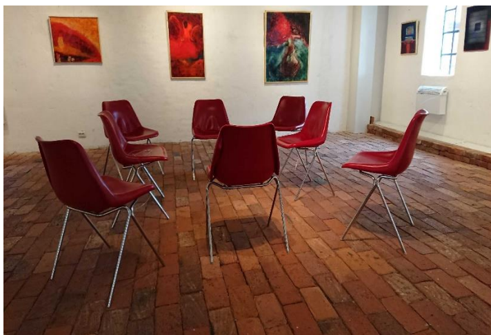
Bild från Konsthallen på Kulturhuset Anders

Skolmuseet har använts av föreningar för att bedriva utställningsverksamhet och visar upp hur en skolsal kunde se ut i slutet av 1800talet samt en sal med mindre tematiska utställningar. År 2018 fick studenter vid Arkiv Biblioteks och Museiutbildningen (ABM) vid Lunds Universitet i uppdrag att arbeta fram ett utställningskoncept och tillgängliggöra museet. Idag används lokalerna för guidade visningar av allmänheten. Även skolor använder sig av lokalerna i undervisningen.