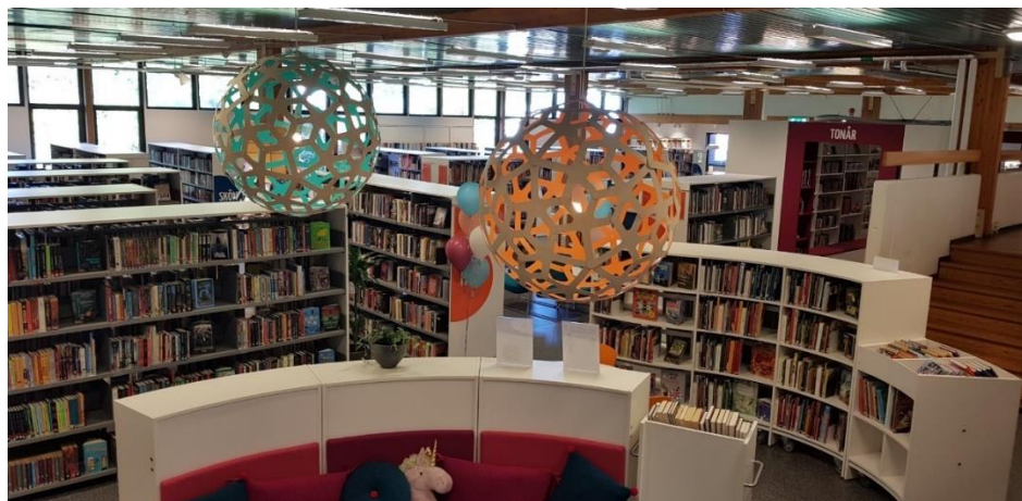
Vy över Höörs bibliotek.