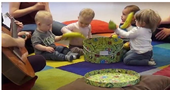
Babyrytmik med Höör Musik-/Kulturskola.

Kulturen i Höör ska vara öppen och tillgänglig för alla. Här ska det finnas något för alla och utbudet speglar befolkningen. En mångfald av perspektiv, uttryck och berättelser där möten kan samla människor oavsett kön, ålder, etnisk tillhörighet, sexuell läggning, trosuppfattning, politisk åsikt eller social klass. Detta tar sitt avstamp i ett salutogent förhållningssätt där ungdomar och vuxna kommer till tals och lockar fram medborgarnas egna förmågor och drivkrafter till utveckling i enlighet med KAF:s nämnduppdrag. Kulturen ses som en del av kommunidentiteten. Sedan flera år har Höör kommun varit omtalad som en ort med ett rikt kulturliv- tack vare ett rikt föreningsliv och en välkänd Musik-/Kulturskola. Detta lockar flera kulturaktörer att flytta till Höör för att förverkliga sina projekt. Denna bredd och kvalitet på fritidsaktiviteter för unga bidrar till att locka både besökare och nya medborgare till kommunen. Höör kommun är inte en ort att bara bo och arbeta i- här finns möjligheter att ta del av och vara delaktig i ett rikt kulturliv.