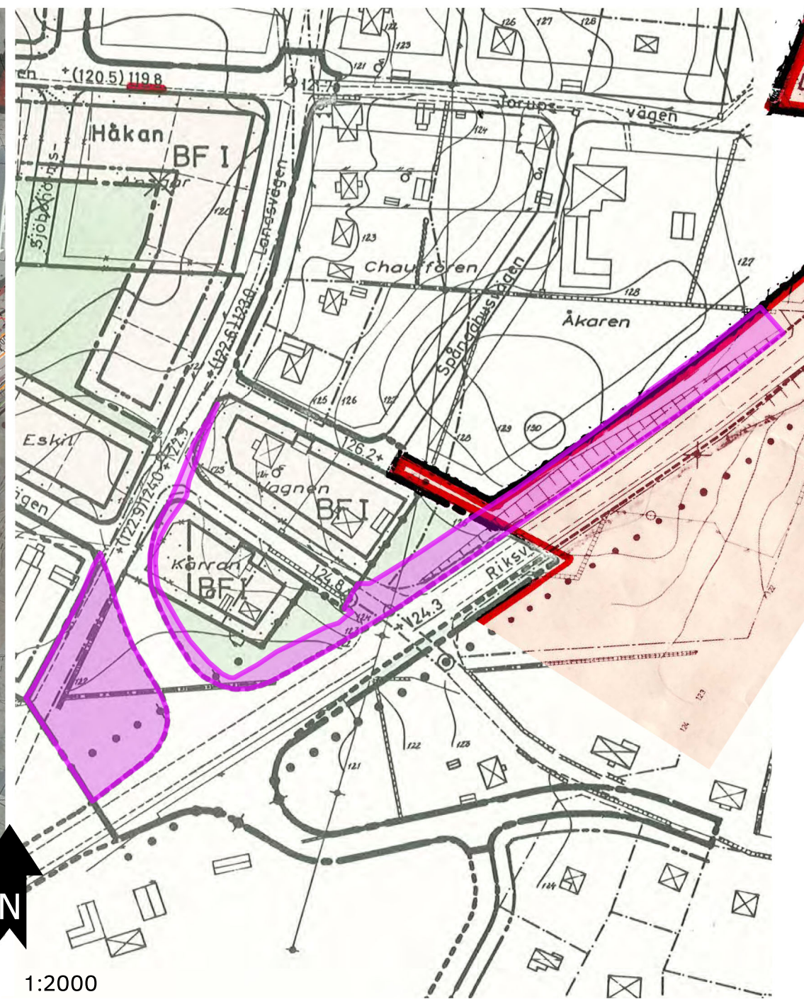
Trafikverkets vägplan ovanpå de gällande detaljplanerna.