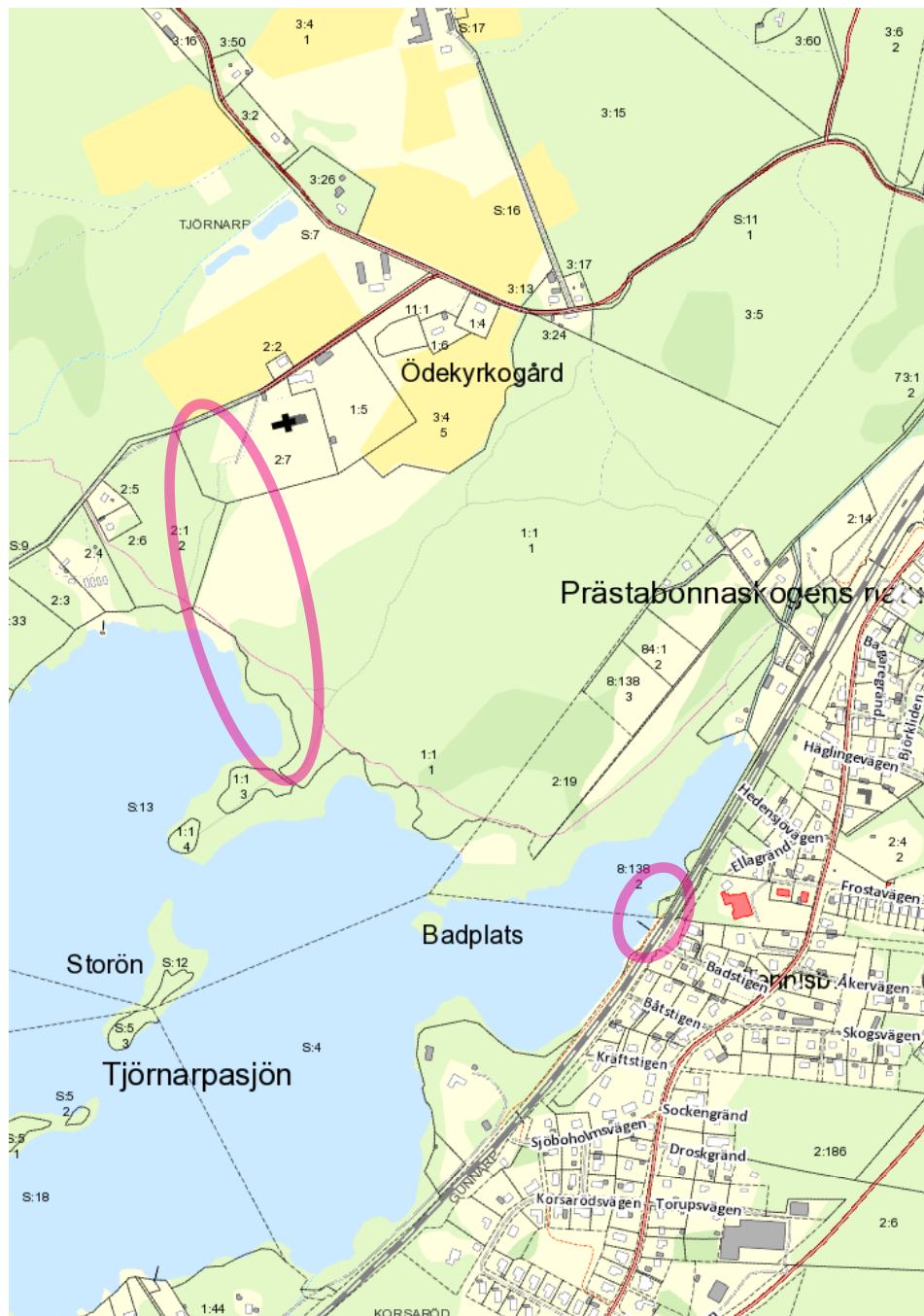
Till vänster visas område för badplatsutveckling vid Kyrkviken. Till höger område för befintlig badplats vid Södra stambanan