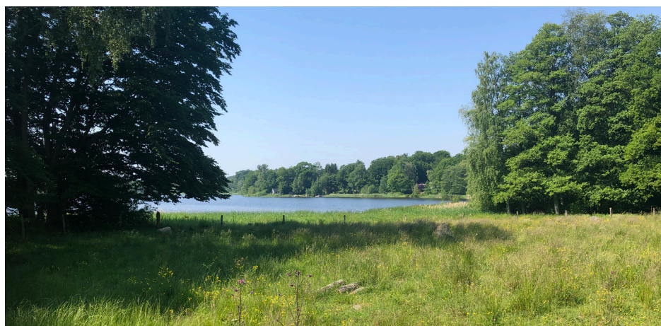
Vy över läge för möjlig badplats vid Kyrkviken