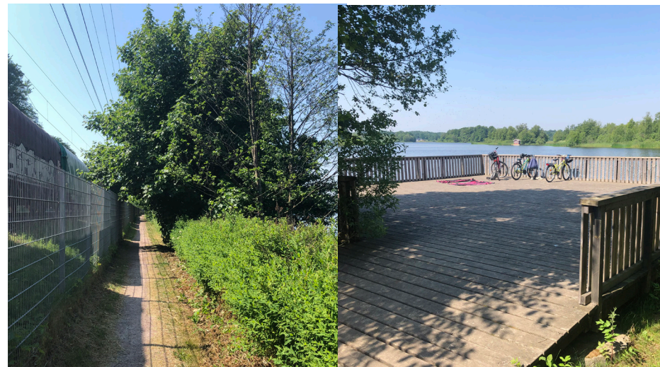
Vägen till badplatsen vid Södra stambanan samt bild på trädäck vid badplatsen.