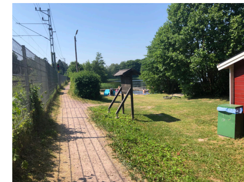
Läge för befintlig badplats vid spårområdet