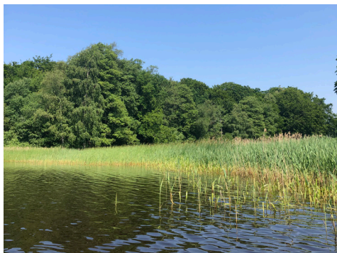
Läge för badplatsutveckling vid Kyrkviken

Kyrkviken är det läge där kommunen bedömer det som genomförbart att utveckla en badplats som Höors kommun kan sköta. Frågan om skapande av angöringsväg för drift, anläggningsfordon och räddningstjänst är helt avgörande. Den smala passagen till befintlig badplats i kombination med begränsat utrymme vid badplatsen samt bullersituationen gör att kommunen inte ser några rimliga förutsättningar för att satsa på att utveckla platsen inom badplatsuppdraget.