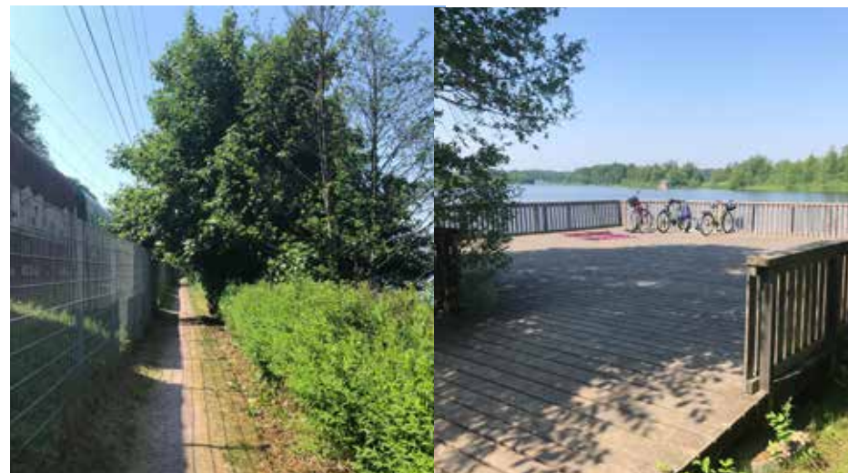
Vägen till badplatsen vid Södra stambanan samt bild på trädäck vid badplatsen.