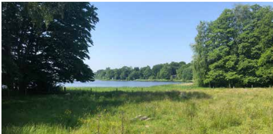
Vy över läge för möjlig badplats vid Kyrkviken