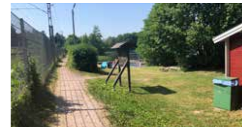
Läge för befintlig badplats vid spårområdet