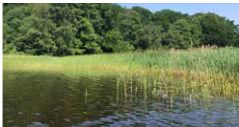
Läge för badplatsutveckling vid Kyrkviken

Slutsats: I Kyrkviken bedömer samhällsbyggnadssektor att det är genomförbart att utveckla en attraktiv badplats som Höors kommun kan sköta. Frågan om skapande av angöringsväg för drift, anläggningsfordon och räddningstjänst är helt avgörande.