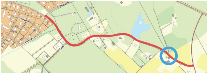
Den del av planområdet som har justerats till detta planskede.

Aktuell planhandling är en revidering av den granskningshandling som var ute på remiss under 6nov-4dec 2023. Förändringen i den utskickade handlingen är att gång- och cykelvägen har justerats i den östra delen.